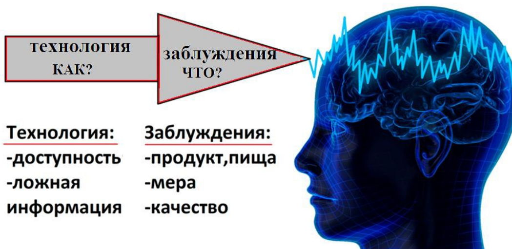
Рисунок 3. Технология манипуляции

После того, как на человека оказано воздействие, он, сам того не замечая, становится запрограммированным. Согласно определению Геннадия Андреевича Шичко, «питейно запрограммированный — верующий в мифические свойства спиртных напитков» . [58]