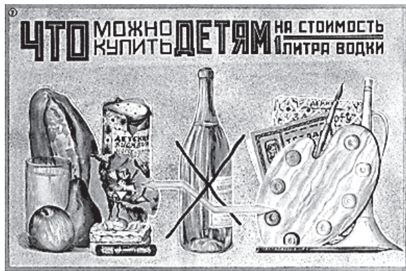
Антиалкогольный плакат 1920 годов

Один из законов маркетинга гласит: «Для увеличения спроса надо уменьшить предложение. Это азбука маркетинга. И в итоге борьба за трезвость сверху всегда приводила к нужному результату: пьянство