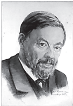
Иван Михайлович Сеченов (1829–1905), «отец русской физиологии»

Вот что рекомендуют врачи: трезвость! Она – лучший помощник врача, незаменимая профилактика многих и многих болезней.