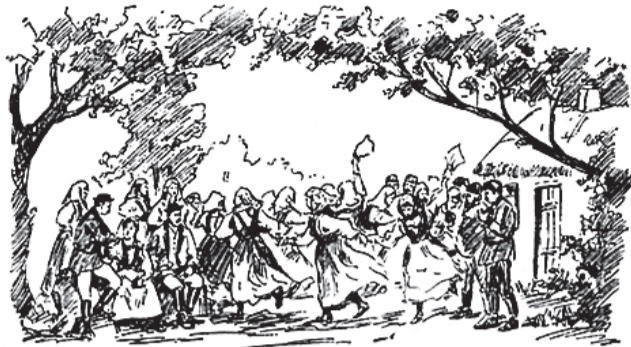
Сцена последнего акта из оперы «Барышня-крестьянка»

заключительную сцену 2-го акта – хороводную пляску девушек. На левом плане только что помолвленная чета: барышня-крестьянка со своим женихом, и возле них старый помещик, её отец. Вокруг группы охотников и крестьянских девушек».