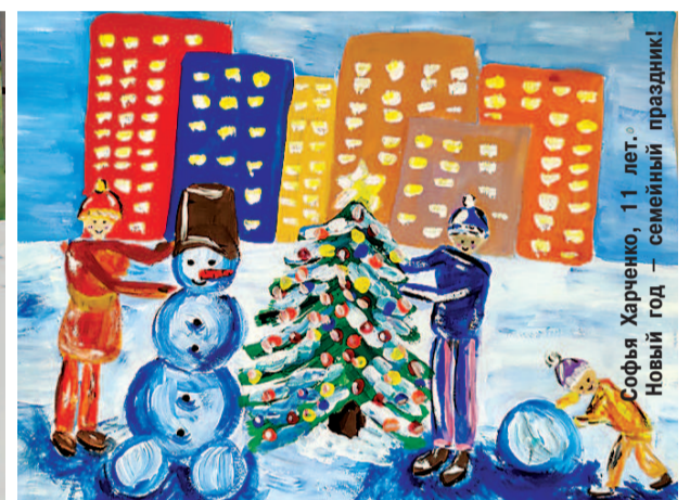
Софья Харченко, 11 лет. Новый год – семейный праздник!