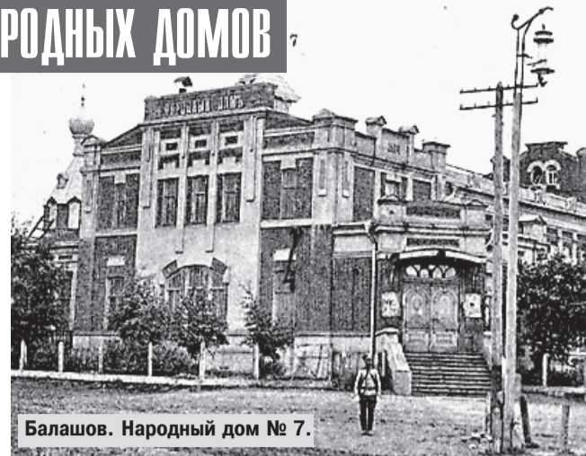
Балашов. Народный дом № 7.

В 1902 году «для Дуровской чайно-читальни (в Сердобском уезде) местное крестьянское общество выстроило дом с устройством в нём зала для спектаклей, народных чтений и т.п. за 4500 рублей». Собирали деньги на постройку Народного дома и в селе Завьялово Саратовского уезда, однако скопленных 750 рублей не хватило, обратились в Саратов, однако ходатайство уездного попечительства губерния не удовлетворила: мода на Народные дома со сценами для постановки пьес не только в уездных центрах, но и в рядовых поселениях ставила губернское по-