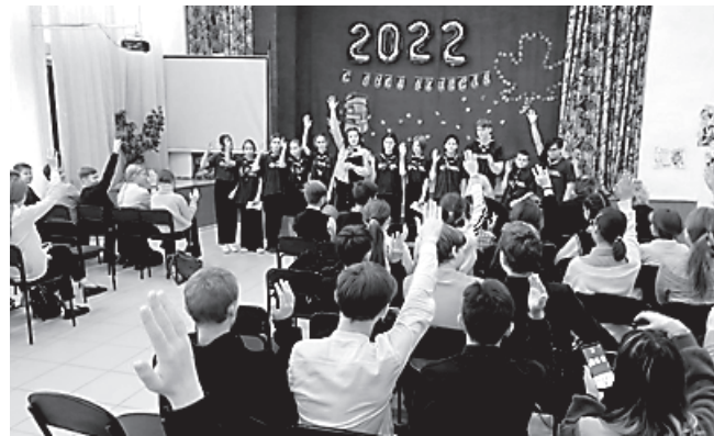
Перед началом игры «Ключи здоровья» в школе № 3 г. Петровска

Спрашивали скаутов в основном о том, как стать скаутом, что для этого нужно делать, для чего нужны лесные имена, и что означают нашишки на рукавах у скаутов. Получили исчерпывающие ответы на каждый свой вопрос. Игра «Ключи здоровья» очень понравилась детям. Тем более, что по её окончании все игроки получили вкусные призы — шоколадки.