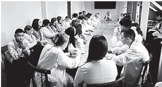
Старшеклассники школы № 1 г. Пугачёва, ученики медицинских классов, на уроке трезвости 18 октября 2022 года в Доме трезвости

В рамках президентского проекта «Марафон трезвости» продолжается заполнение нашей виртуальной карты Саратовской области точками трезвости. С начала нового учебного года штаб Ассоциации скаутов Саратовской области разыскал и нанёс на карту точки трезвости в Балашове и Петровске, а школьники с пугачёвской точки трезвости побывали в гостях у саратовской точки, посетив наш новый Дом трезвости на улице Шевченко, 2.