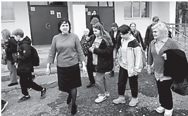
Скауты после игры «Ключи здоровья» во дворе школы № 16 г. Балашова

Проигравших не было: каждой команде скауты вручили на церемонии награждения сладкие призы — корочки с печеньками с глазурью. А завершился для скаутов день в Балашове прогулкой по набережной Хопра, благо, день запоздавшего бабьего лета располагал к общению с природой.