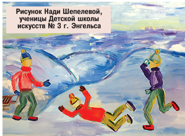
Рисунок Нади Шепелевой , ученицы Детской школы искусств № 3 г. Энгельса