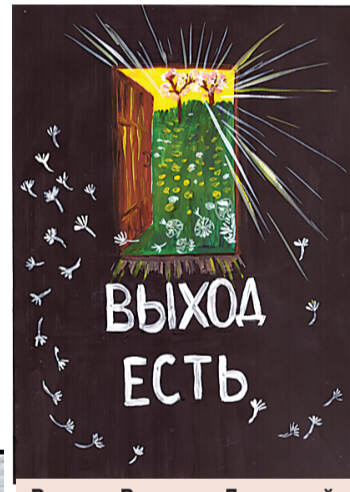
Рисунок Виктории Дудоровой , ученицы 9 класса лицея «Солярис» г. Саратова