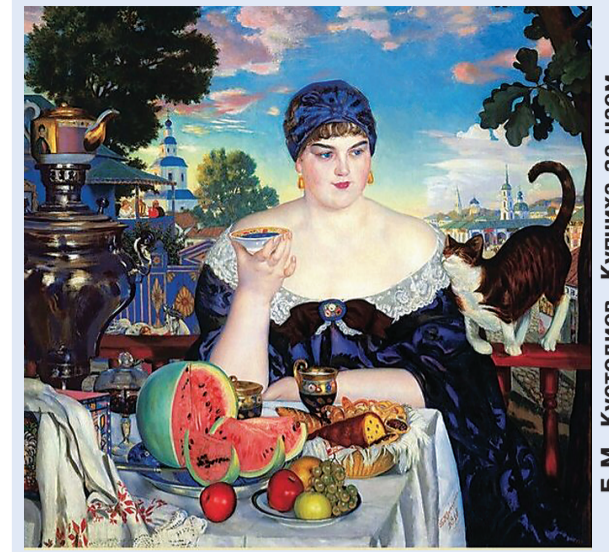
Б.М. Кустодиев. Чашка за чаем. 1918 год.