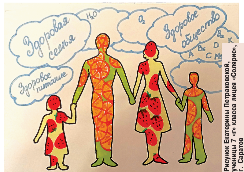
Рисунок Екатерины Петраковской , ученицы 7 «г» класса лицея «Солярис», г. Саратова

Номер газеты издан при финансовой поддержке министерства здравоохранения Саратовской области.