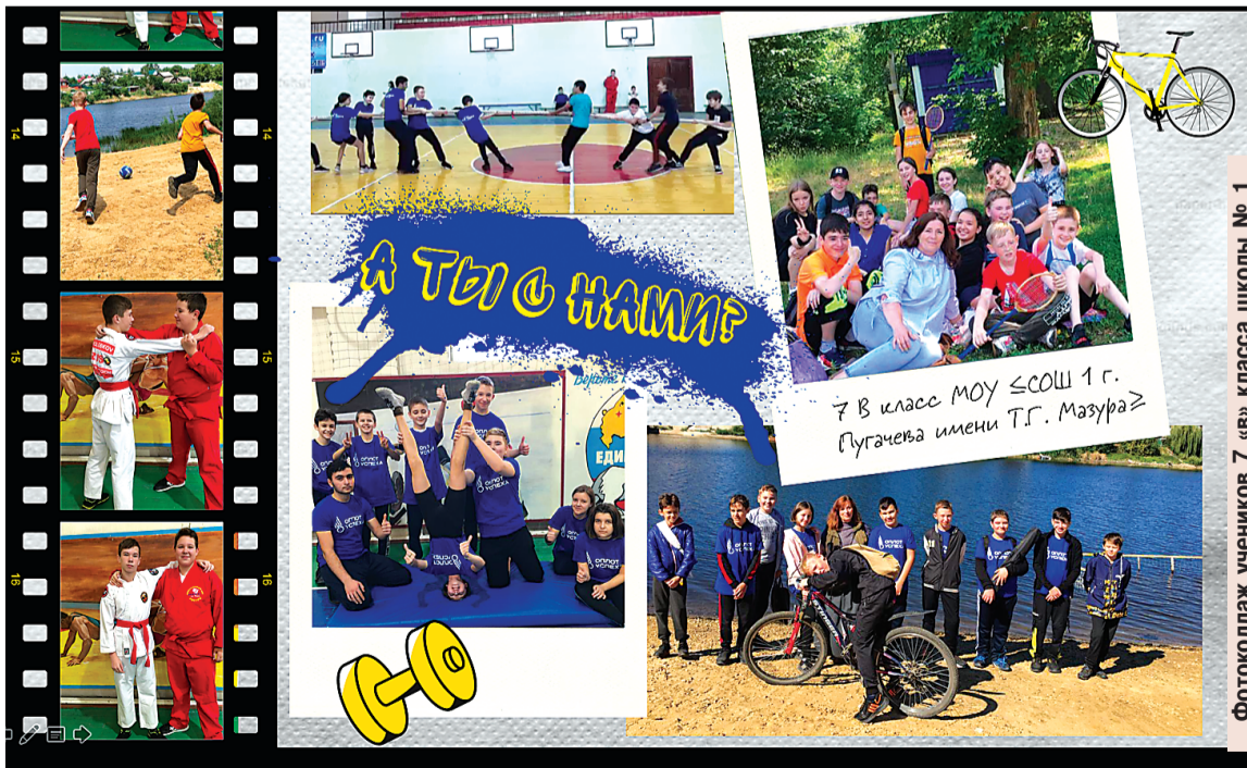
7 В класс МОУ СОШ 1 г. Пугачёва имени Т.Г. Мазура