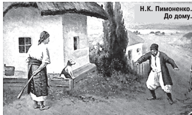
Н.К. Пимоненко. До дому.

Ну зачем современному потребителю знать такие страшные вещи? Уж лучше сообщить ему, что до сих пор алкогольные изделия относятся к... пищевым продуктам! Пункт 3.1 «безопасность