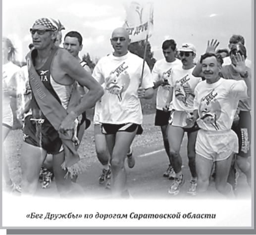
«Бег Дружбы» по дорогам Саратовской области