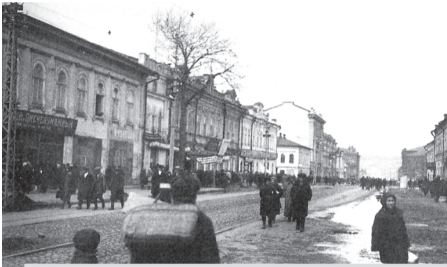
Здание клуба «Красный строитель» — в центре фотографии, снимок 1920-х годов, современный адрес ул. Горького, 37: здесь 3 августа 1928 года состоялось организационное совещание по вопросу создания в Саратове общества по борьбе с алкоголизмом

Таким образом, 20 августа можно считать днём создания саратовского отделения ОБСА. Заявив, что «основная задача, которую ставит себе общество, — организация общественности в борьбе с алкоголизмом и с его последствиями, как социальным злом, центральный совет поста-