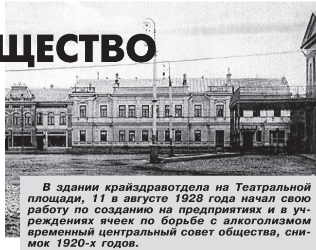
В здании крайздравотдела на Театральной площади, 11 в августе 1928 года начал свою работу по созданию на предприятиях и в учреждениях ячеек по борьбе с алкоголизмом временный центральный совет общества, снимок 1920-х годов.