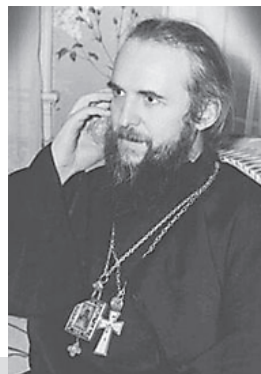
Архиепископ Иоанн (в миру князь Дмитрий Алексеевич Шаховской; 23 августа 1902, Москва — 30 мая 1989, Санта-Барбара, Калифорния, США) — епископ Православной церкви в Америке, архиепископ Сан-Францисский и Западно-Американский. Проповедник, писатель, поэт.