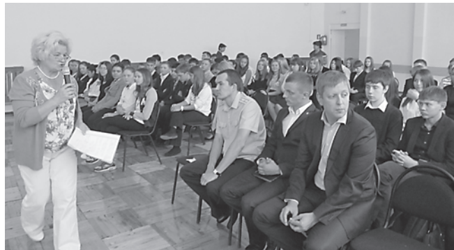
Всё лето в Доме трезвости по пятницам заседал штаб формировавшегося проекта «Саратов молодой», инициированного городской администрацией Саратова. Обсуждали, какие мероприятия наметить на ближайшее будущее, чем заняться в долгосрочной перспективе. Начало активного продвижения проекта – с первых дней нового учебного года. В первую декаду сентября решили провести уроки трезвости во всех школах, гимназиях, лицеях. Один из первых уроков прошёл в Гуманитарно-экономическом лицее 3 сентября 2015 года.