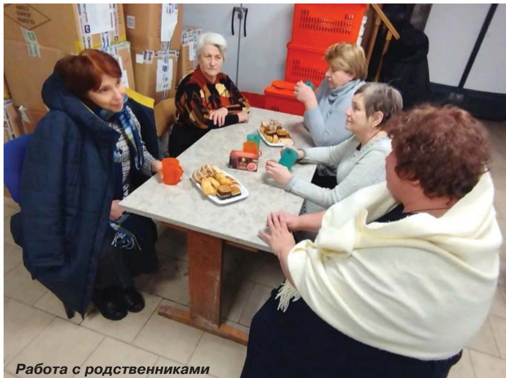
Работа с родственниками