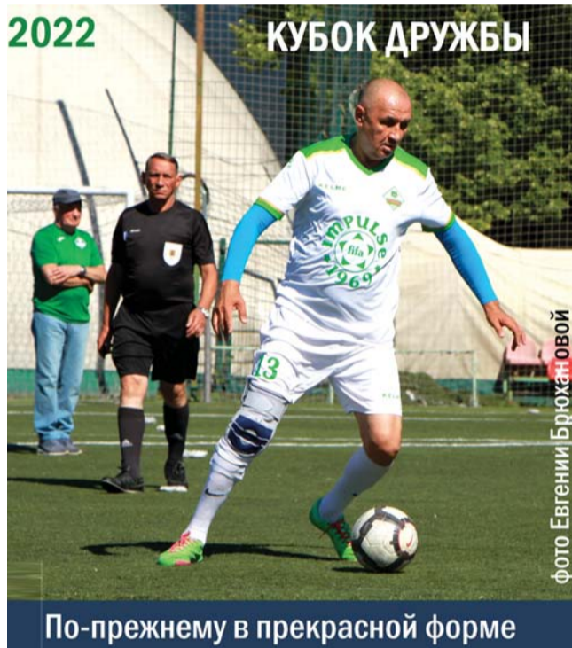
По-прежнему в прекрасной форме