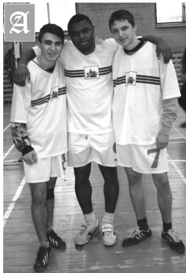
Контора Трезвости (Ивановск)

вещь замечательная. Но если ещё удастся сыграть за одного из грандов трезвой серии, то это вообще здорово. Столичную команду "Контора Трезвости" из Ивановска* возглавляет ве-