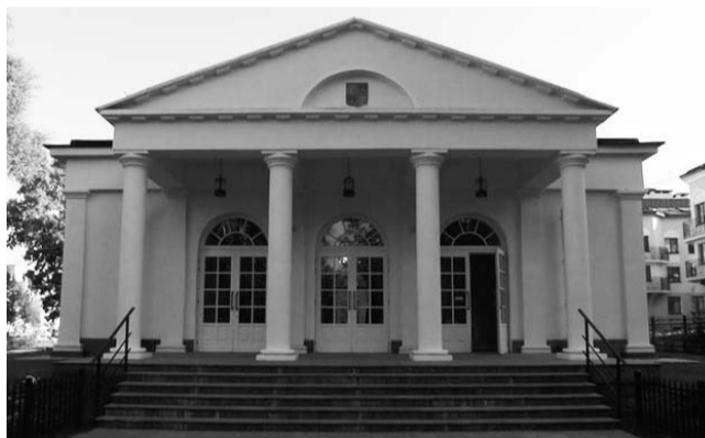
Фото и видео праздника выложены в группе ВКонтате: http://vk.com/club105270602

Завершал праздник плейбек-театр «Давайте Посмотрим».