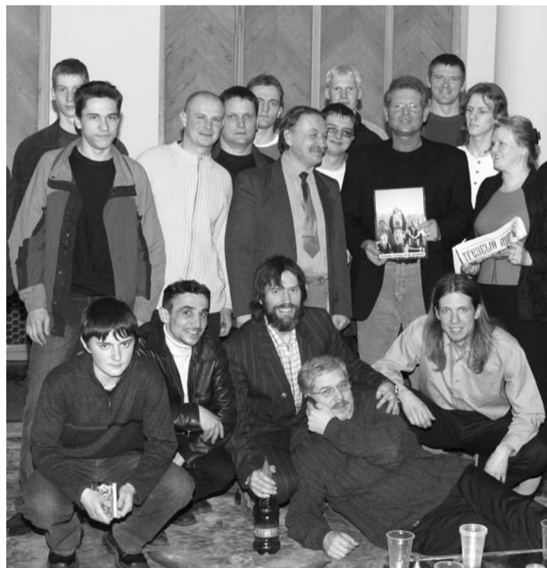
Пресс-конференция в Доме Радио. "Истинно чешский характер: Властимил Петржела".