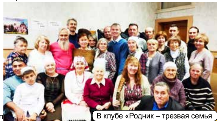
В клубе «Родник – трезвая семья»