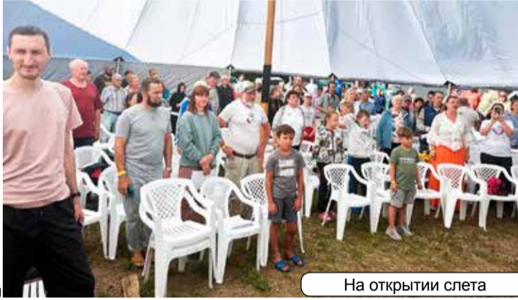
На открытии слета

Этим не ограничивался спортивный блок слета: баскетбол, метание ножей, веселые старты. Ежегодный традиционный заплыв через озеро Тургояк. Моржи держат высокую планку.