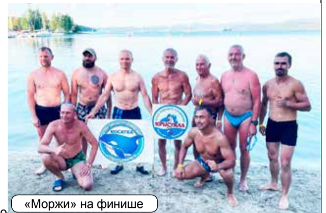
«Моржи» на финише

утренние зарядки, курс по самообороне, скандинавская ходьба с палками; спортивные соревнования по различным видам спорта (шахматы, дартс, метание ножей, волейбол), весёлые старты, походы на Таганай, знакомство с местными достопримечательностями и многое другое.