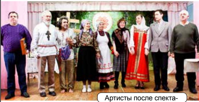
Артисты после спектакля

Несмотря на некоторые проблемы со здоровьем, он также энергичен и творчески силен. Недавно он написал спектакль