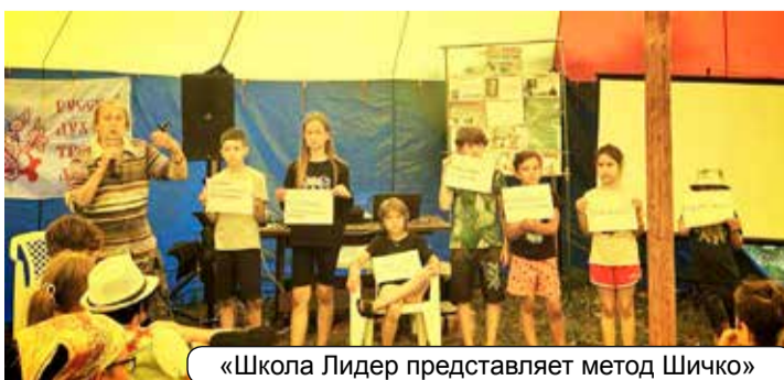
«Школа Лидер» представляет метод Шичко»

Подготовили и провели программу литературно-музыкальной композиции «Разговор». Задача данной программы – через стихи, прозу и музыкальное исполнение эмоционально погрузить слушателей в вопросы выбора, смыслов, ответственности.