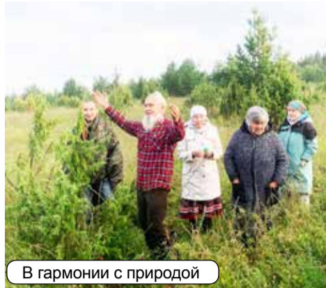
В гармонии с природой