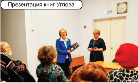
Презентация книг Углова

Ветераны узнали о Федоре Григорьевиче Углове, академике АМН СССР, лауреате Ленинской премии, профессоре, докторе медицинских наук, советском и российском хирурге, авторе книг. Федор Григорьевич известен не только как выдающийся хирург, но и как общественный деятель и просветитель, активный приверженец здорового трезвого образа жизни. Примером здорового образа жизни