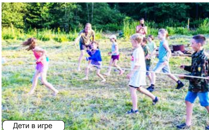
Дети в игре