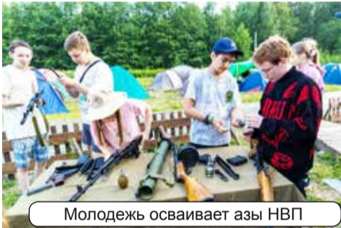
Молодежь осваивает азы НВП

Наши соратники-фронтовики организовали в рамках слёта небольшой экскурс в начальную военную подготовку, (НВП,) что вызвало большой интерес не только у детей, но и у взрослых. Старшее поколение вспоминало об уроках НВП и гражданской обороны в советской школе, об учебных