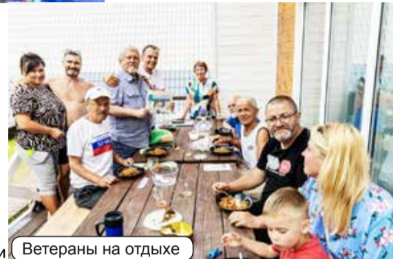
Ветераны на отдыхе

Многие новички уехали с огромным багажом полезных знаний (надеюсь, не растеряли по дороге). А ветераны трезвеннического движения и активные его участники получили Грамоты в честь 120-летнего Юбилея Ф.Г. Углова. Всё прошло великолепно! Особо хочется отметить концерт «Алло! Мы ищем таланты». Талантов оказалось много. Даже дети исполняли свои стихи и песни,