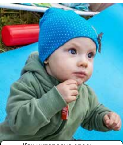
Как интересно здесь...

Одно слово, произнесенное про себя или вслух, и на лице расцветает улыбка. И сразу — волна тёплых воспоминаний: о слётах, соратниках, друзьях, о красоте уральской природы, песнях у костра, задушевных разговорах, мечтах о лучшем будущем для Родины, ради которого и жизнь отдать не жаль!