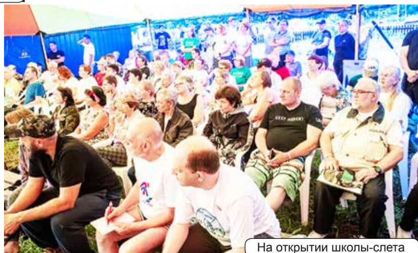
На открытии школы-слёта

Слёт мне всегда представлялся живым организмом, сильным и энергичным в свои