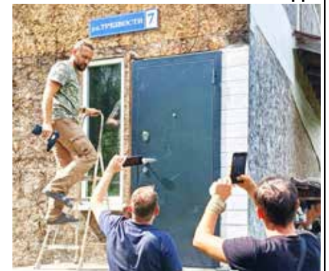
Деревня Исканское, с/п Некрасово, Тарусский район, Калужская область