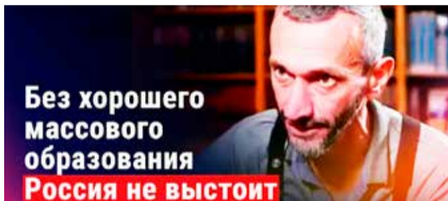
Без хорошего массового образования Россия не выстоит

Конечно же, это не так. Вопрос отмены ОГЭ/ЕГЭ стал обязательным политическим шоу перед каждыми выборами (введение ЕГЭ в его первой, тестовой форме, действительно, было ударом по образованию). Однако сейчас, если мы хотим возродить систему образования, нужно наладить в первую очередь процесс получения знаний школьников.