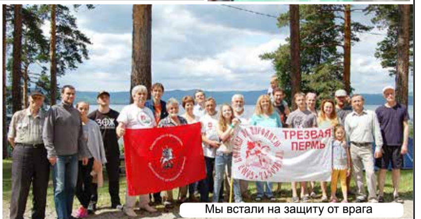
Мы встали на защиту от врага

этом прекрасном озере. Вести здесь подробный репортаж об открытии слета не вижу смысла, когда видеозапись его уже выложена в интернете ( https://youtu.be/2-MJ3P71aU8 ), и в современных условиях практически любой может посмотреть её и наглядно познакомиться с ходом этой церемонии. Правда, любительская запись оставляет желать лучшего качества, но суть происходящего она отражает с документальной точностью. Здесь же назову лишь ос-