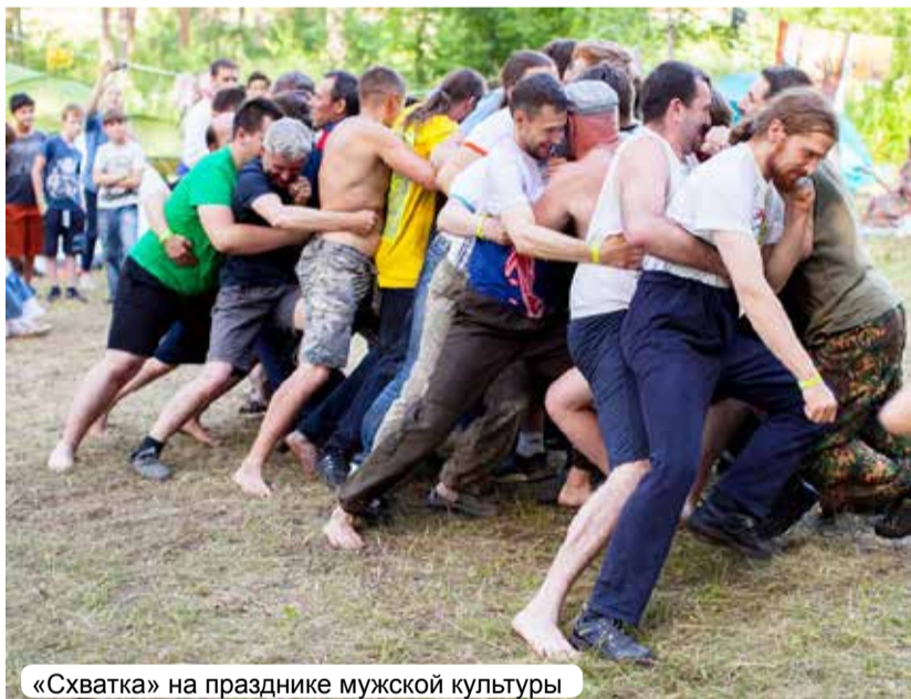
«Схватка» на празднике мужской культуры

Культурная программа включала в себя несколько локальных кон-