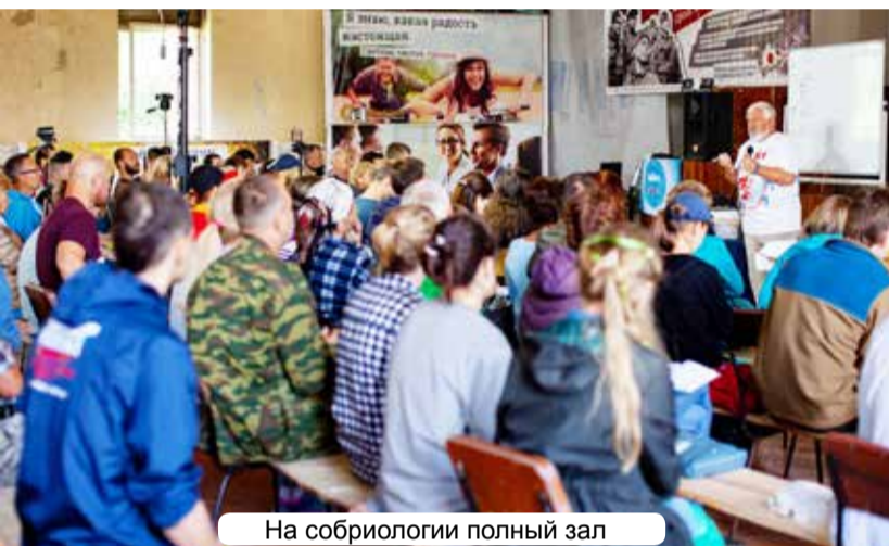
На собриологии полный зал

Очень важное мероприятие, которое раньше проводилось в рамках съезда МЗТР, в этом году было организовано лидерами этой