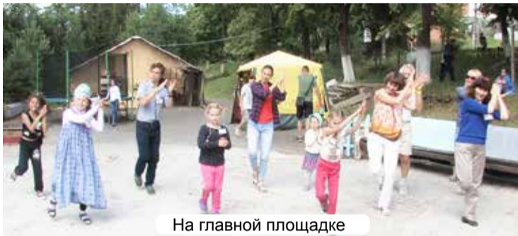
На главной площадке

Слёт – это удивительная возможность побывать в кругу счастливых и свободных людей. Свободных в плане раскрепощенных, открытых и ясноглазых! После приезда многим «культуропитейшикам» рассказывала о слёте. Услышав название, многие сразу говорили, что это нужно людям у которых есть проблемы с алкоголем. Но мой ответ был однозначным, что это нужно, прежде всего, людям, у которых нет выраженной зависимости, а есть зависимость от общества в котором принято