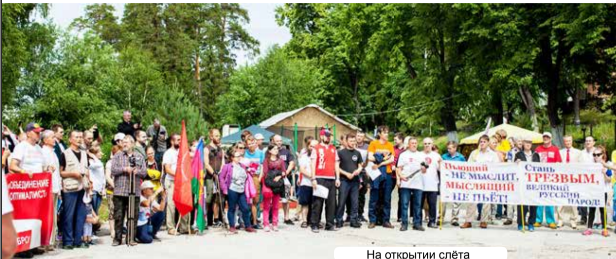
На открытии слета

что это положение улучшится, велика, поэтому не раз поднимался вопрос – где проводить следующий слет. Но чарующие красоты Тургояка, как магнитом притягивающие к себе любого, появившегося на его берегах, никак не позволяют отказаться от проведения слета на