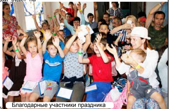
Благодарные участники праздника

В связи с этим еще одна огромная благодарность коллективу театра «Солнечный Принц», который проводил на слёте праздники для детей и взрослых. Праздники способные объединять все возрасты в светлом и прекрасном! Праздники, которые научают наших детей, да и нас, взрослых, радостному и доброму общению, и несут высокие нравственные образы!