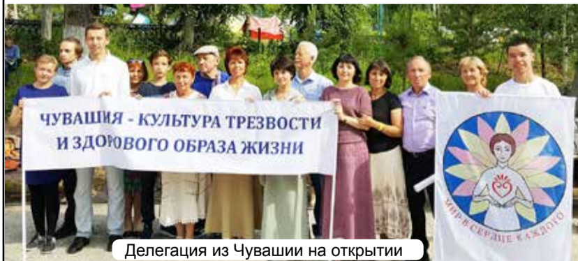
Делегация из Чувашии на открытии

Очередной съезд МЗТР также привлёк внимание многих соратни-