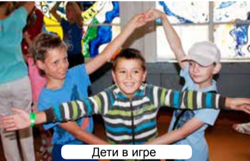
Дети в игре

Слёт активных, деятельных и творческих людей из разных уголков нашей страны собрался в тридцатый раз, чтобы подвести итоги отрезвления и оздоровления общества. А главное – для творческого наполнения жизни смыслами созидательной деятельности. Новые встречи, знакомства, обмен опытом, лекции, шокирующие своими данными, совместные планы – все это разом обрушилось на наши головы. Удивило – как красивые, здоровые, трезвые мужчины и хрупкие, нежные женщины ведут такую масштабную патриотическую работу в своих регионах.