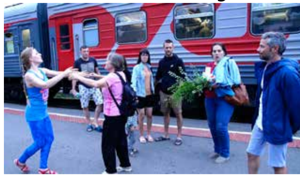
Танцы на перроне

Отпуск... Но это же школа-слёт! Школа, где обучают эффективной трезвеннической деятельности на местах, дают знания. Для чего я поехала туда? Прежде всего, чтобы зарядиться энергией и большей мотивацией