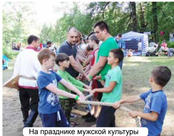
На празднике мужской культуры

В материалах о слете использованы фотографии Ольги Барановой, Ильи Бабошко, Марселя Валиахметова, Игоря Горбачёва, Ивана Кондратьева и других неизвестных авторов, размещенные в интернете https://vk.com/album-39006397_263246629 – ред.