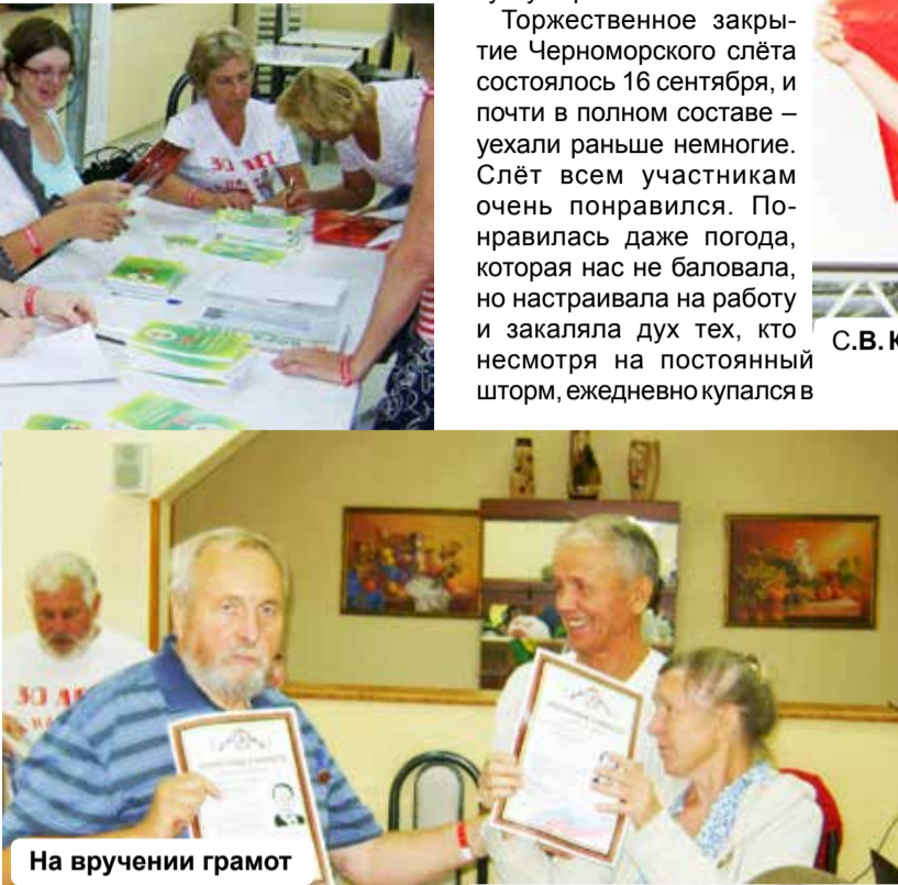
На вручении грамот

вариант газеты очень важен и все трезвеннические газеты нужно сохранить в этом формате. А это зависит от посильного вклада каждого соратника – начиная с заметок и