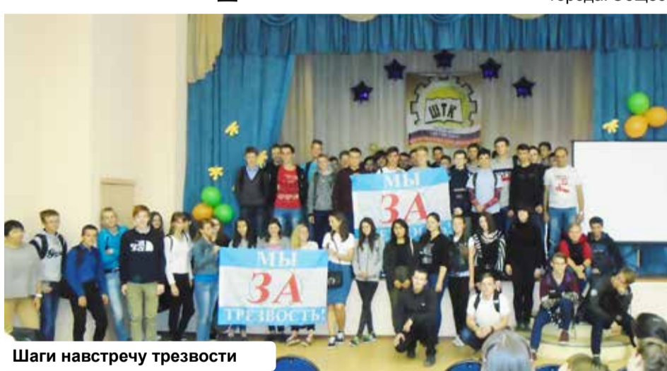
Шаги навстречу трезвости

несколько мероприятий, приуроченных ко Всероссийскому Дню Трезвости.