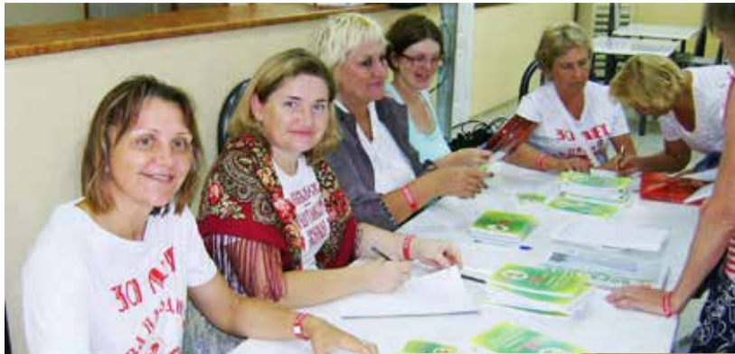
Регистраторы делегатов съезда

- на сайте организован форум; - общими усилиями было найдено несколько десятков (более 40 человек) действующих преподавателей курсов по методу Шичко, у которых