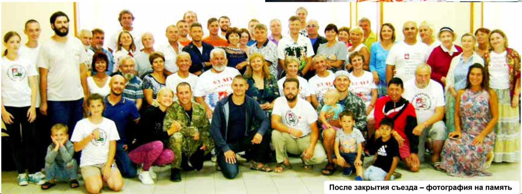
После закрытия съезда – фотография на память