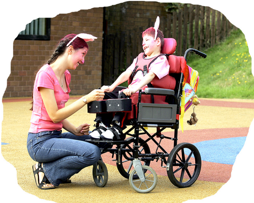
А если это «хорошее» вино?