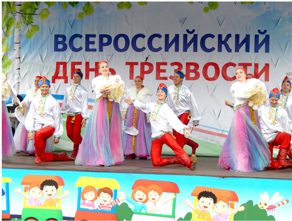
День трезвости в Ижевске

Цели проведения конкурса «Трезвое село-2016» были определены как: