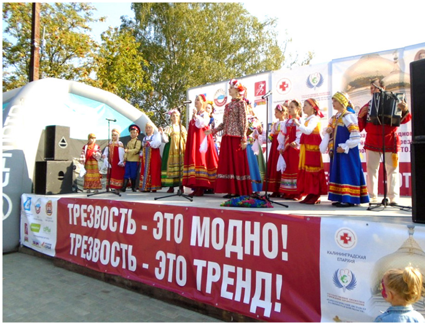
Всероссийский День трезвости в Калининграде

5) метаболическая. Печень отвечает также за обменные процессы в организме.