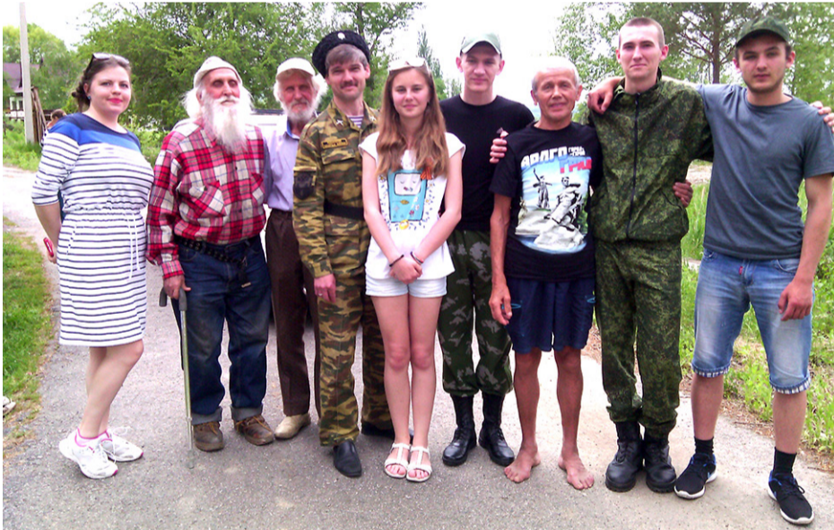
На слёте трезвых сил Юга России. Май 2017

Важно произвести оценку границ реального потребления алкоголя на душу населения с привлечением экспертов и научных методик и знать, сколько же всё-таки пьёт народ? Ещё важнее изменить политику борьбы со «злоупотреблениями алкоголем» на разумные действия по отрезвлению народа. Призывы «пей меньше» должны уступить место девизу «Живи трезво!»