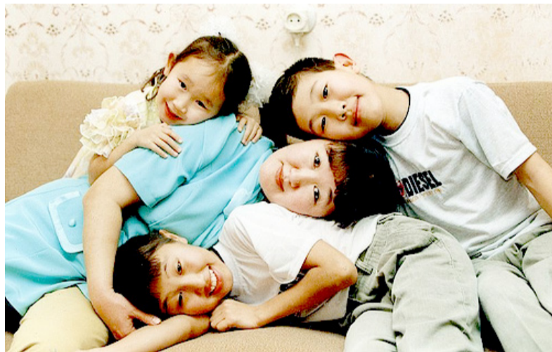
Якутия. Братья и сёстры.

завозить спиртное дальше Якутска. И никакие «бутлегеры» не могли спаивать население так, как уничтожает его легальная торговля алкоголем. Сейчас они активизировались, но достижения трезвых сёл велики и говорят сами за себя.