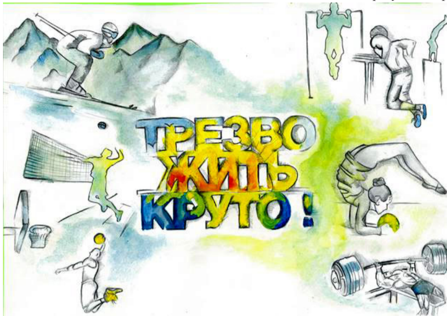
Якутия. Конкурс детских рисунков.

йода и йодиол, перекись водорода, растворы марганцово-кислого калия, борной кислоты, формалина, сулемы, медного купороса и др. Ни одно из этих веществ – аналогов алкоголя по антисептическому действию и функциональному предназначению – не употребляют внутрь для веселья.