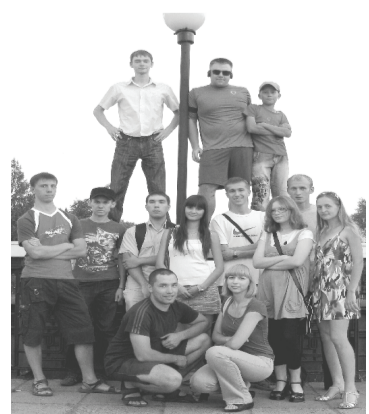
(Продолжение на 4-ой полосе)

22 июля у монумента Дружбы народов по инициативе участников группы и партии КПЕ (Курсом Правды и Единения) был про-