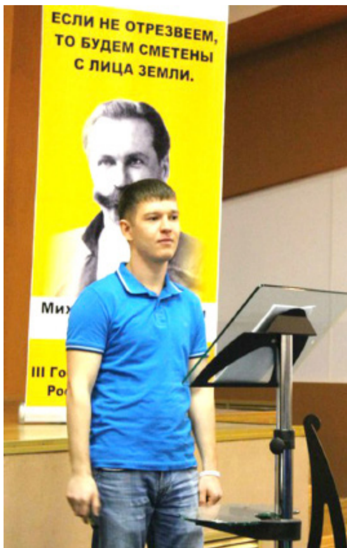
Выступление на Съезде трезвых сил России

Реально законопроект заработал только в мае 1914 года в предверии трезвой политики царского Правительства. Газеты и брошюры публиковали