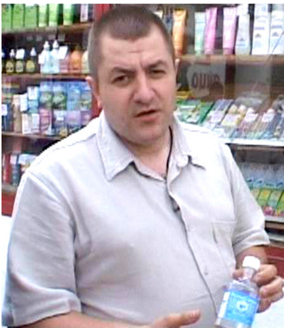
Вице-президент Фонда «Город без