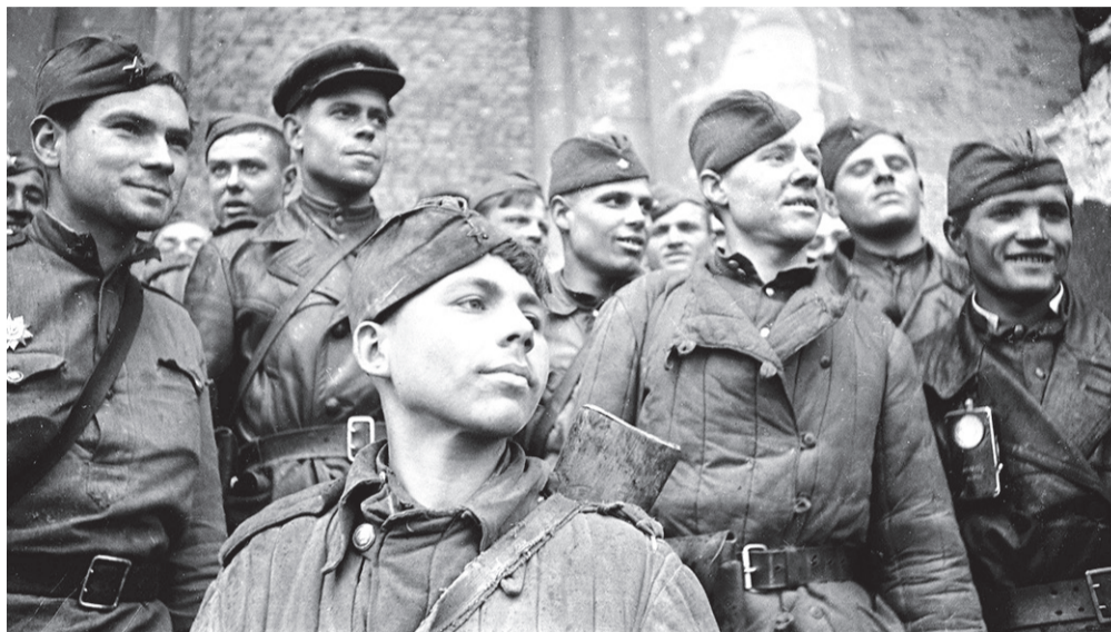
Солдаты Великой Победы

По предложению Президента Владимира Путина 2015 год призван также стать годом борьбы с сердечно-сосудистыми заболеваниями. И хотя многие уверены, что коньяк и вино полезны для сердца, а водка очищает сосуды, болезни сердца и сосудов являются самой крупной причиной смертности в нашей пьющей стране.