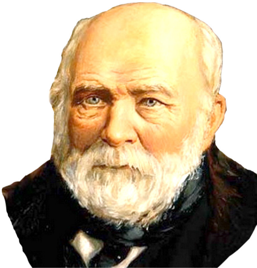
Хирург Николай Иванович Пирогов

Посвященный 100-летию юбилею Н.И. Пирогова, XI Пироговский съезд постановил, что «алкоголь не является