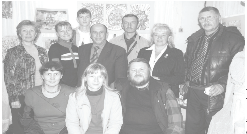
Гости из Республики Татарстан и Воткинска

(Подробнее о празднике на следующей странице)