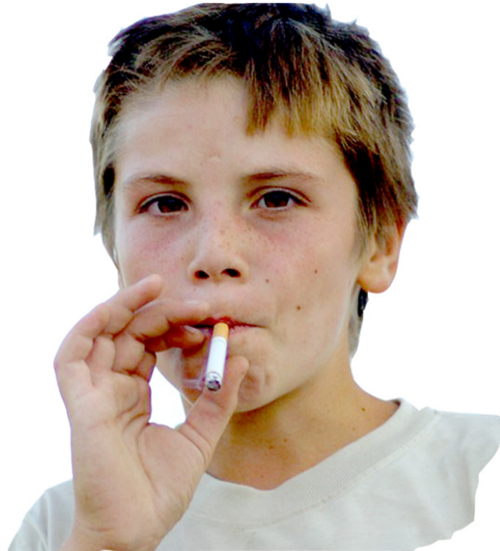
Почему он попался?

количество рецепторов, участвующих в долговременной памяти и достаточно одной сигареты, чтобы занять 88% никотиновых рецепторов. Эти, подтвержденные другими учеными, исследования позволяют утверждать, что симптомы табачной зависимости у подростков могут возникнуть через два дня после первой сигареты.