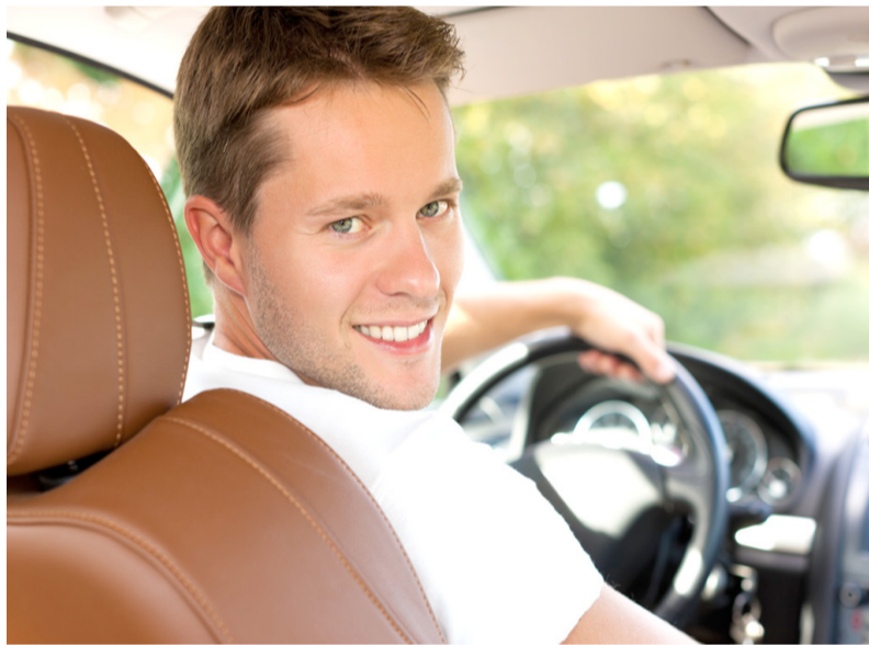
Услуга «Трезвый водитель»

11. Глубоко убежден, что государству пора изменить