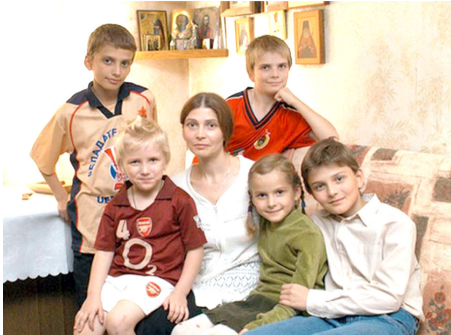
Наш папа самый лучший фотограф!

Для сравнения, при частичном отрезвлении в 1985-88 годах, рождаемость в Советском Союзе возросла на 500 тысяч человек в год, а смертность снизилась на 200 тысяч соответственно. В Турции потребляют примерно 1,5 литра абсолютного алкоголя на человека в год, что, как минимум, в десять раз меньше, чем в России.