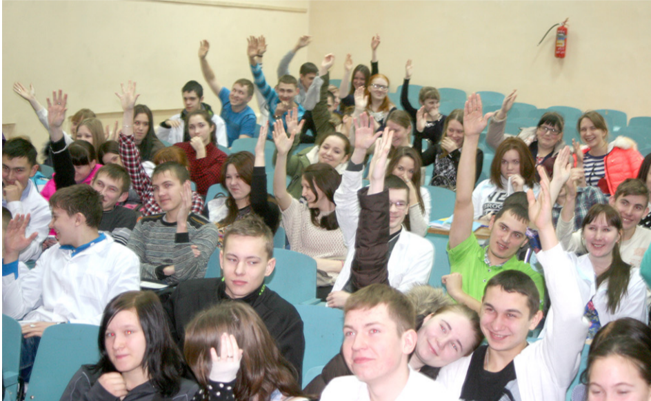
Можга. Учащиеся ветеринарного колледжа за сухой закон