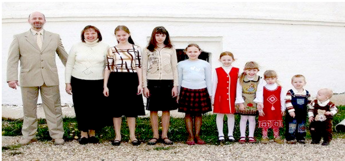
Ещё одна великолепная семья!

Поддержите газету «Родник трезвости» её распространением в своём регионе!