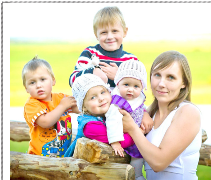
С Праздником, наши милые мамы! Всегда на вас надежда у нас и у страны!

Материнская любовь слепа, мать любит своего ребенка, каким бы он ни был. Это заложено природой.