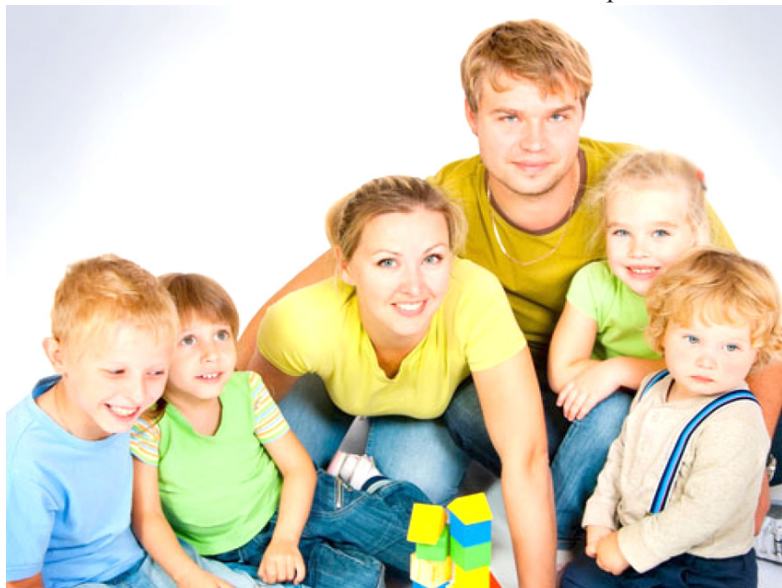
Дайшь трезвость новым поколениям!

Спешу успокоить защитников выпивки – пьяницы как пили, так же пьют и будут продолжать пить. Их может спасти только сухой закон и то не всех. Не в них дело. Ограничения дают возможность нормальным людям пить поменьше, и, в первую очередь, молодым.