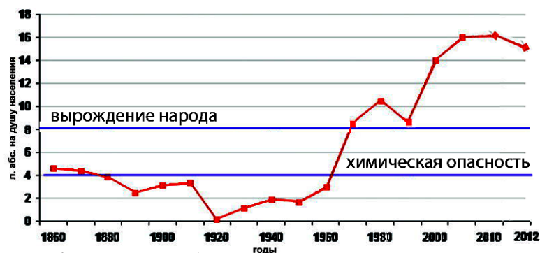
График потребления алкоголя на душу населения в пересчете на чистый спирт

Вот все, что я хотел сказать и довести до сведения господ депутатов Государственной Думы на тот предмет, чтобы они обратили свое внимание на вопиющий вопрос — на народное спаивание, ведущее к окончательной гибели государства, и издали закон, чтобы в России было запрещено винокурение, пивоварение, а также и ввоз всех спиртных напитков и продажа их, признав это как яд, отравляющий тело и душу русского народа, и ведущее к окончательной гибели наше государство.