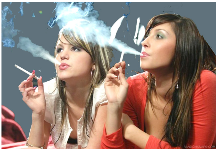
Здоровье будущих поколений в табачный дым

Распространяется мнение, что «запреты на курение ничем не оправданы»(!). Утверждают, что запреты не работают, и этот Закон, напротив, может привести к росту курильщиков среди молодёжи. Что высокие цены не уменьшат потребления табака, а урежут расходы на