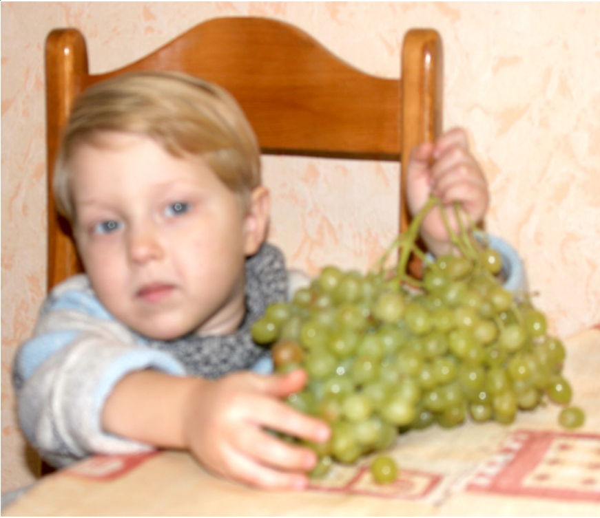
Мальчик и виноград. Или ... и вино?

Эта аксиома исполняется безупречно. В 1984 году в СССР погибло от отравлений алкоголем более 54 тыс человек, а в 1986 году 28 тыс. человек. По России цифры приводятся разные, но соотношение аналогичное.