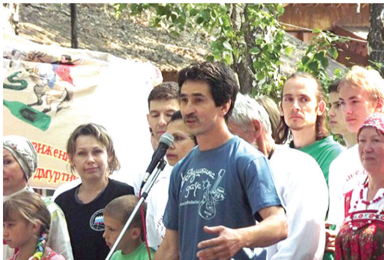
Участники школы-слёта на озере Песчаное

Он призвал соратников всемерно поддерживать создание трезвенной партии. По юридическим причинам партия, скорее всего,