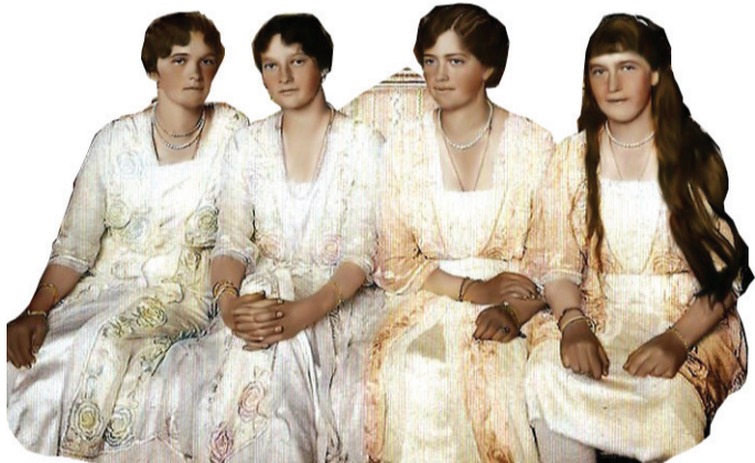
Царевны Ольга, Татьяна, Мария, Анастасия

побочным продуктом алкогольного стиля жизни нашей страны. Почти половина из них проходит тюрьмы, треть спивается, треть не может создать семью. Считается, что лишь 10% детдомовцев устраивают свою жизнь нормально. А сейчас детей могут отправить в детдом если нет определённого набора продуктов