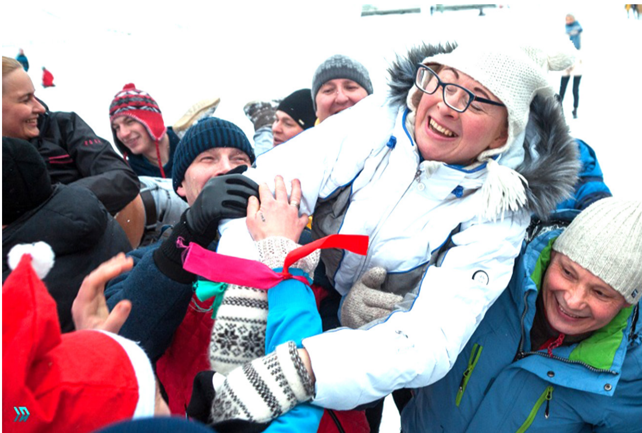
Трезвый Новый год. Веселье на трезвой пробежке в Ярославле.

Не как не могут понять некоторые люди, что веселье, как и счастье находится внутри человека. Потому и удивляются привыкшие к питу, как это так веселятся на трезвую голову, да ещё круче пьяненьких. Их непонимание удивляет потому, что на трезвую голову жизнь всегда лучше идёт, энергичнее, веселее, интереснее. Пьяные минуты, как дым, рассеиваются, а непонятно куда.