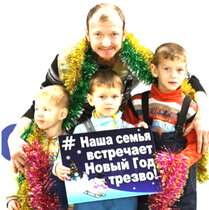
Трезвый Новый год. Один сын – не сын, два сына – полсына, три сына – вот это уже сын!

Недавно глава Минпромторга Денис Мантуров сообщил, что контрафакт в 2018 году вырос почти в два раза с 4,5% до 8,4% по сравнению с 2017 годом.