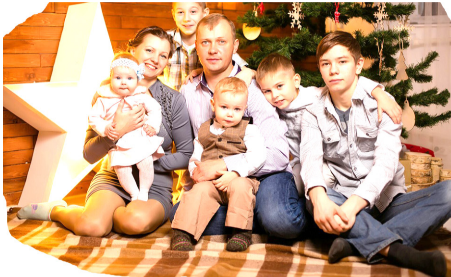
С Новым Годом! Семейного крепкого счастья вам, благополучия и добрых дел!

было таких насыщенных недель. Он продержался без спиртного три месяца. Проалкогольные убеждения рано или поздно обязательно заставляют таких людей снова взять рюмку в свои руки.