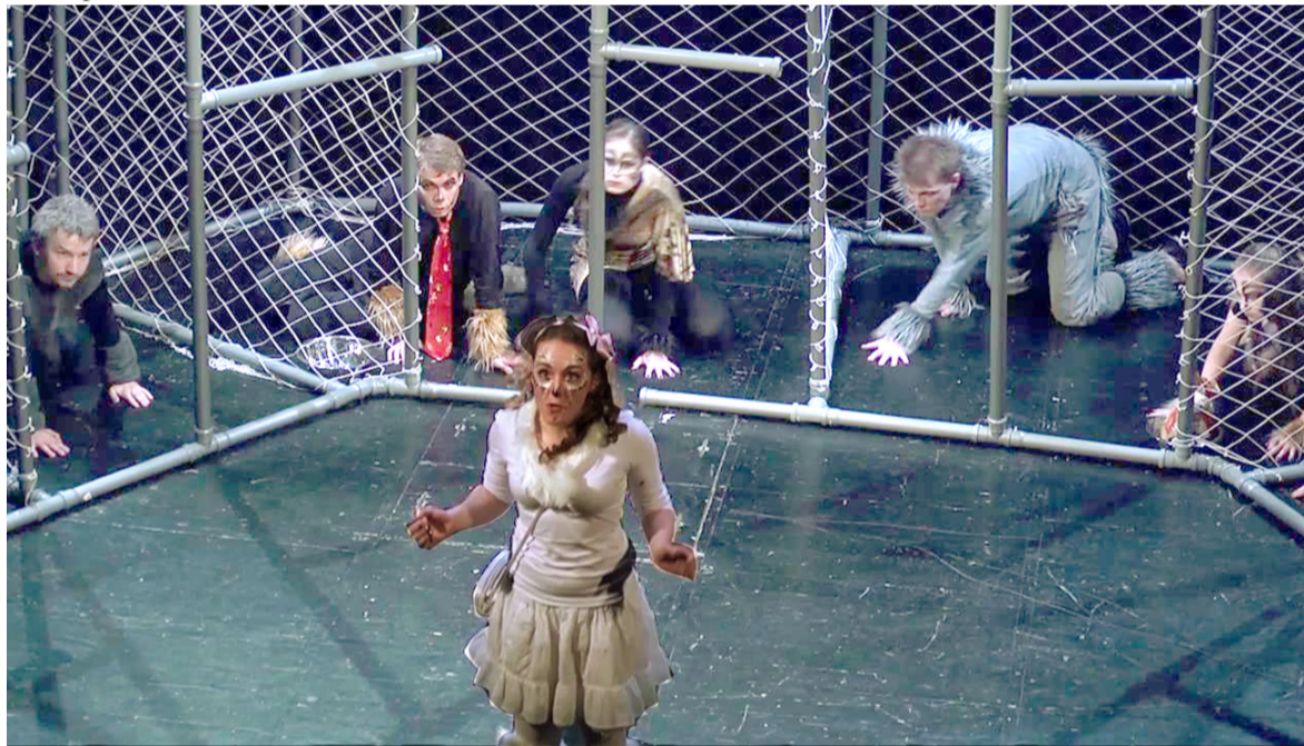
Сцена из спектакля «Клетка»

Было бы неплохо через вас собрать группу людей, желающих снять эту зависимость. Я не занимаюсь борьбой с пьянством и алкоголизмом. Я помогаю человеку вернуть то состояние, в котором мы родились. Мы же все родились трезвыми. Это наше естественное состояние. А вот куда оно уходит, как оно уходит?