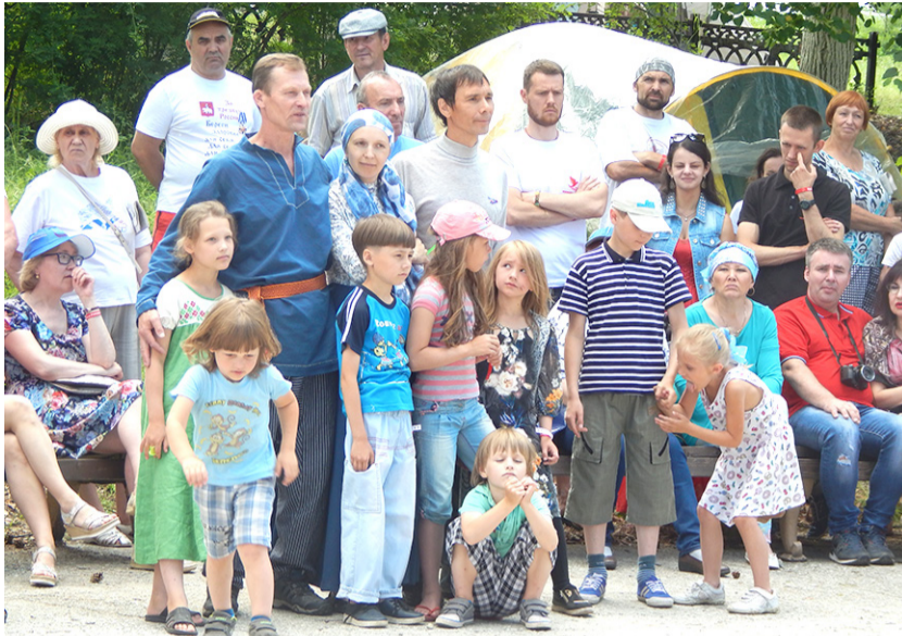
Перед открытием слёта-школы трезвеннических сил «Тургояк-2018»

организациями: кто из них умней, кто из них лучше, кто из них передовой. Занимайтесь, раз вы думаете, что это шестое трезвенническое движение. Будет, наверное, и седьмое, и девятое... А мы считаем, что основы современного трезвеннического движения заложил академик Углов. И методологически смысл открытия Углова состоит в том, что в стране идёт алкогольная война, война на уничтожение нашего народа. И все, кто не потерял стыд и совесть, кто чувствует ответственность за будущее страны, вставай на защиту нашего народа. Союз борьбы за народную трезвость тридцать лет назад, опираясь именно на таких людей, и был создан. Я считаю, это самая боевая организация, это в каком-то смысле элита трезвеннического движения.