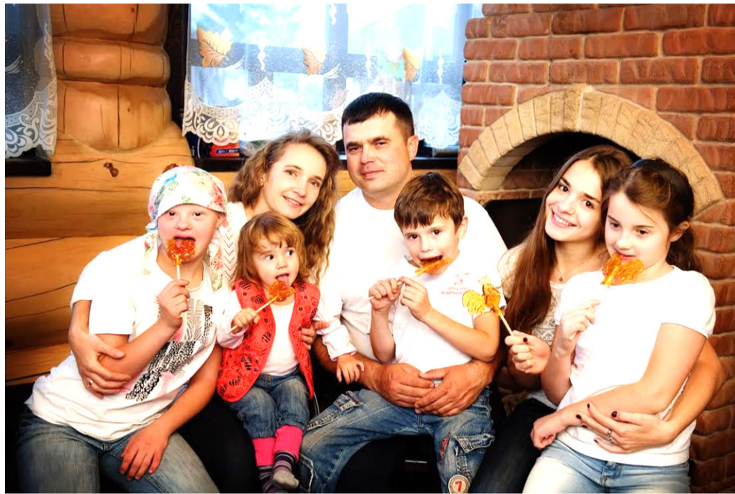
Нормальная семья детьми богата

Да и как таковой ген пьянства не обнаружен. А в том, сопьется или нет в будущем подрастающий человек, играют роль десятка два различных факторов, облегчающих путь в пьянство: в каком возрасте он приобщился к алкоголю, как протекали беременность и роды у мамы, пила ли она во время беременности, какими болезнями болел, были ли травмы головы, какие у него вес, пол, образование, профессия, смакуют ли в его семье алкоголь, как часто вино стоит на столе, какой характер и темперамент ребёнка, в каком окружении вырастает, насколько внушаем... И никакой провидец не скажет вам - сопьётся этот ребенок или нет. Только сознательная трезвость