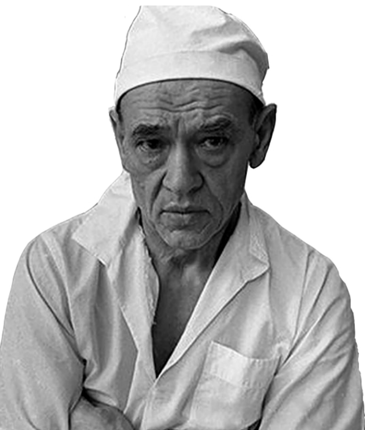
академик Федор Григорьевич Углов (1904-2008 г.г.)

Мы подошли к предельной черте, за которой идёт самоуничтожение нации, когда умирает больше, чем рождается, а из родившихся