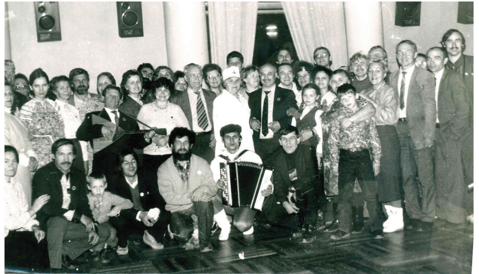
Ученые трезвенного движения в гостях у клуба «Родник»