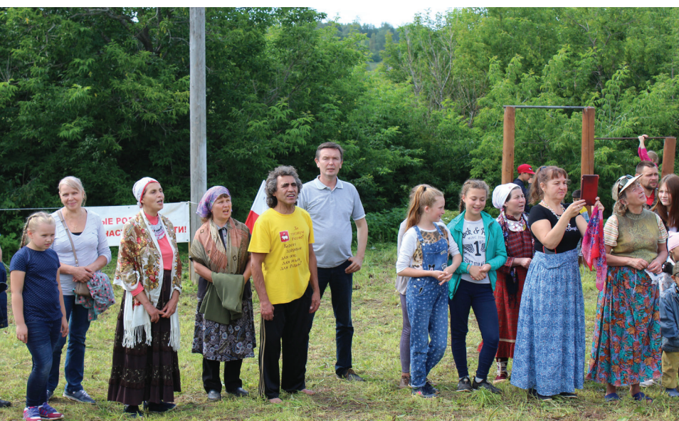
Праздник села «Кельчинские зори»