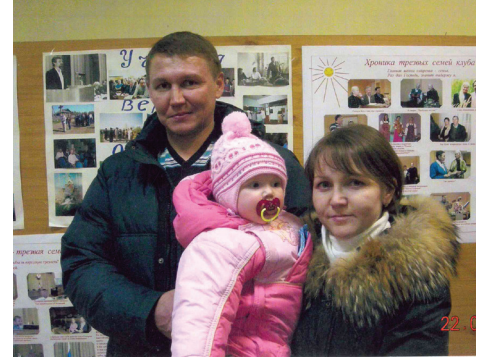
Семейные клубы трезвости