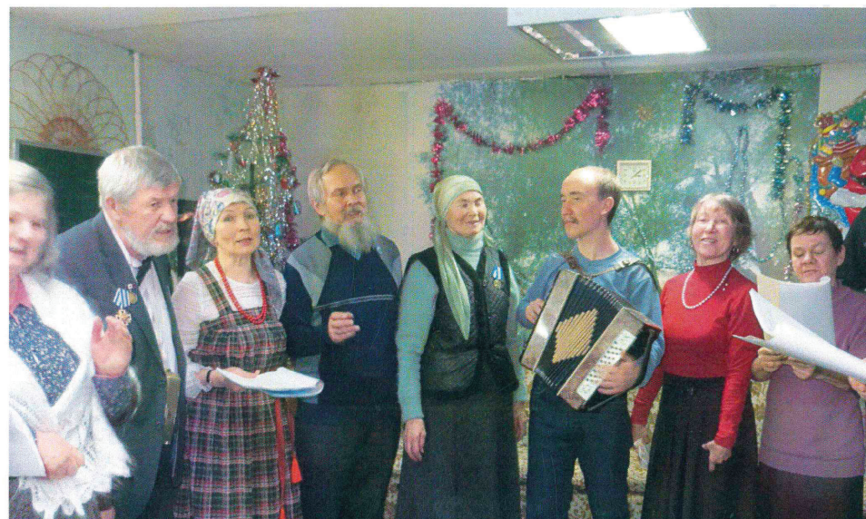
Подготовка к празднику