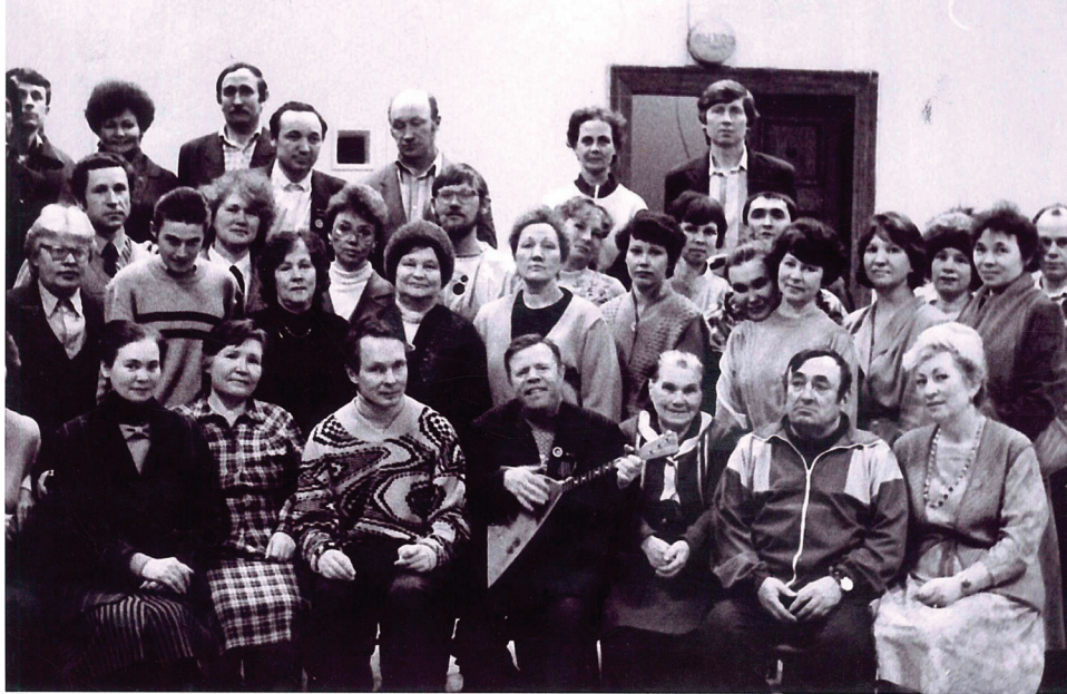
Они были первыми