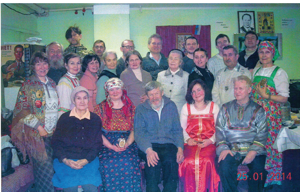
Татьянин день в клубе «Родник»