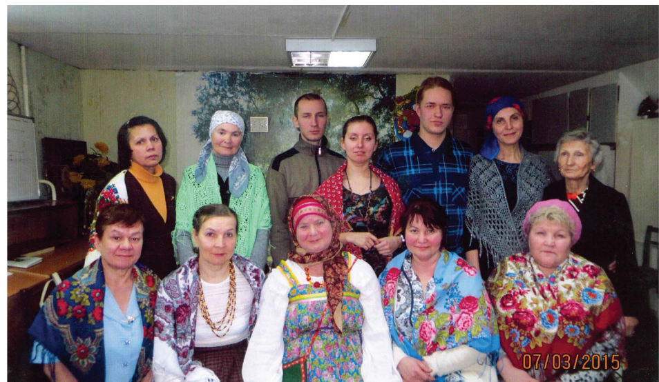
Традиционная культура украшает нас