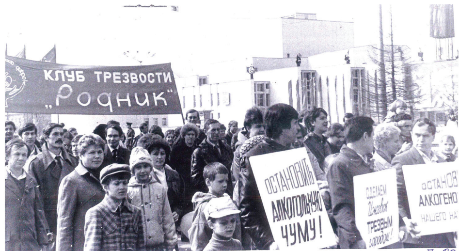
Клуб «Родник» – народный защитник