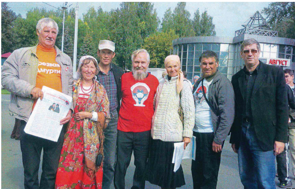
Наша первая газета «С любовью к жизни»