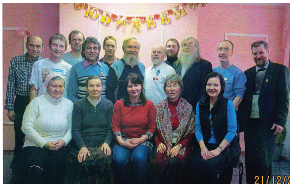
30 лет клубу «Родник»