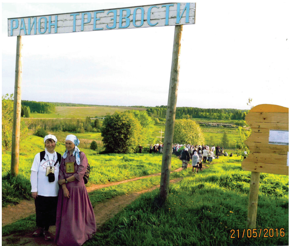
В Кельчинском районе трезвости