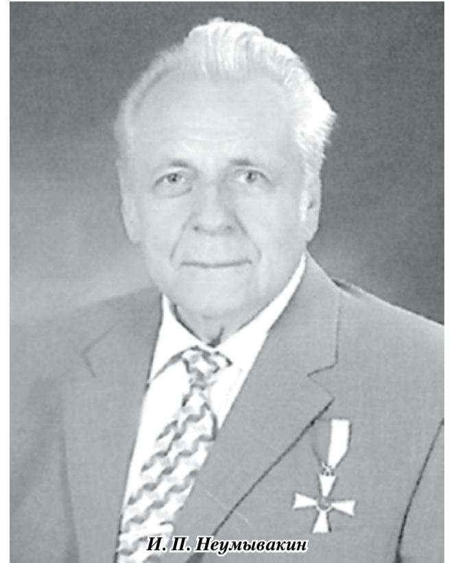
И. П. Неумывакин

Перекись водорода рекомендуется принимать и наружно в качестве компрессов. Например, при болях в шейном отделе позвоночника на четверть стакана воды (50 мл) добавляют 1-2 ч. ложки 3%-ной H 2 O 2 , смачивают салфетку и накладывают компресс на 1-2 часа. Другой вариант применения при пародонтозе, для устранения запаха изо рта 1-2 чайные ложки перекиси подержать во рту 20-30 сек., потом сплюнуть. Или так, 1 часть перекиси, 1 часть пищевой соды смешать – на тампон и чистить зубы, массировать десны 4-5 минут. Делать эту процедуру утром и вечером. По данным