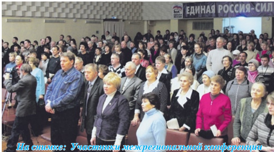
На снимке: Участники межрегиональной конференции